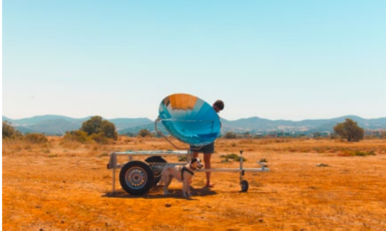
Mit Beiträgen von: Kris De Decker, Hypercomf, Tung-Hui Hu, Florine Lindner, Joana Moll, Karolina Sobocka, Andrea Vetter u. a.

Theoretiker*innen und Praktiker*innen erörtern die Problematik des grenzenlosen Fortschritts und untersuchen dessen Auswirkungen auf den Planeten, wobei auch die Bedeutung der geologischen Zeit und des planetarischen Stoffwechsels angesprochen wird. In diesem Zusammenhang steht auch die Rolle der Technologie im Vordergrund, wenn es um Kontroversen geht, die sie in Bezug auf das Schaffen, Einnehmen oder Verschwenden von Zeit sowie hinsichtlich der Zukunftsgestaltung hervorruft. Beispiele von Low-Tech und traditionellem Wissen werden als Modelle für eine nachhaltigere, auf Entschleunigung und Postwachstum basierende Gesellschaft vorgestellt. Schließlich werden sich die Referent*innen auf Ansätze konzentrieren, die nicht nur für einen Verhaltenswechsel, sondern auch für einen systemischen Wandel bei der Nutzung von Energie, Ressourcen und Zeit plädieren.